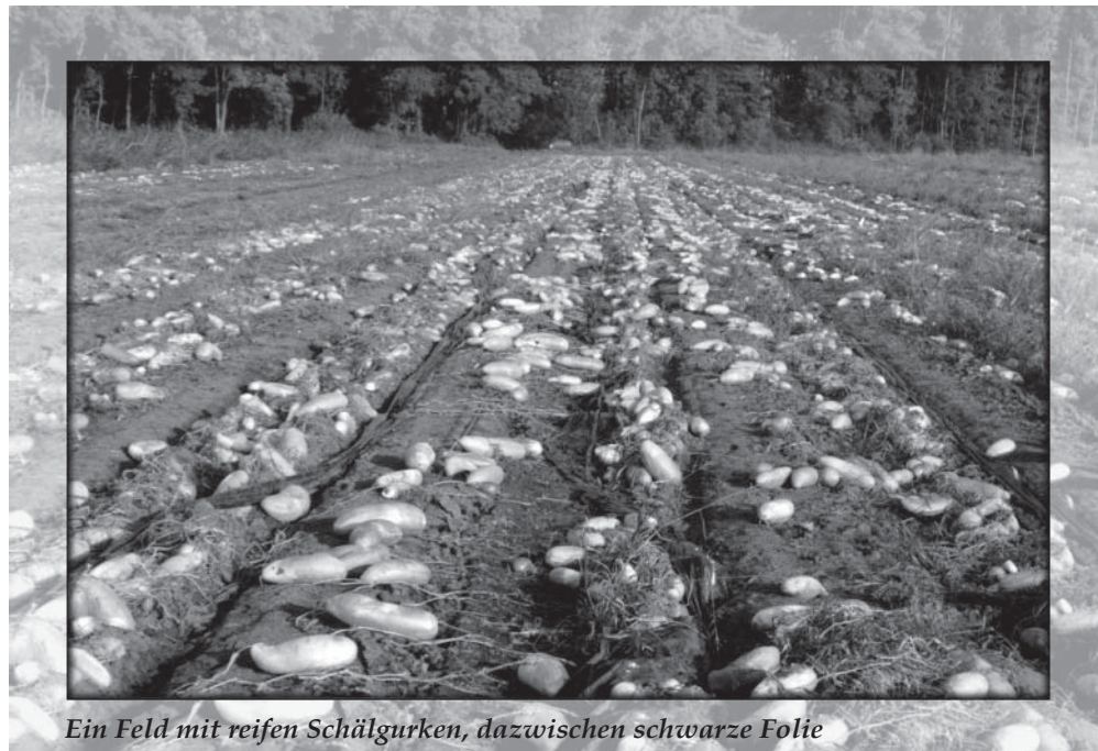
Ein Feld mit reifen Schälgurken, dazwischen schwarze Folie

Diese Methode brachte drei Vorteile: Der Erdboden unter der Dachpappe war durch eventuell auftretende Kältegrade geschützt, die junge Pflanze hatte durch die abgegrenzte Öffnung Halt, und um die Pflanze herum konnte weit weniger Unkraut wachsen als bisher.