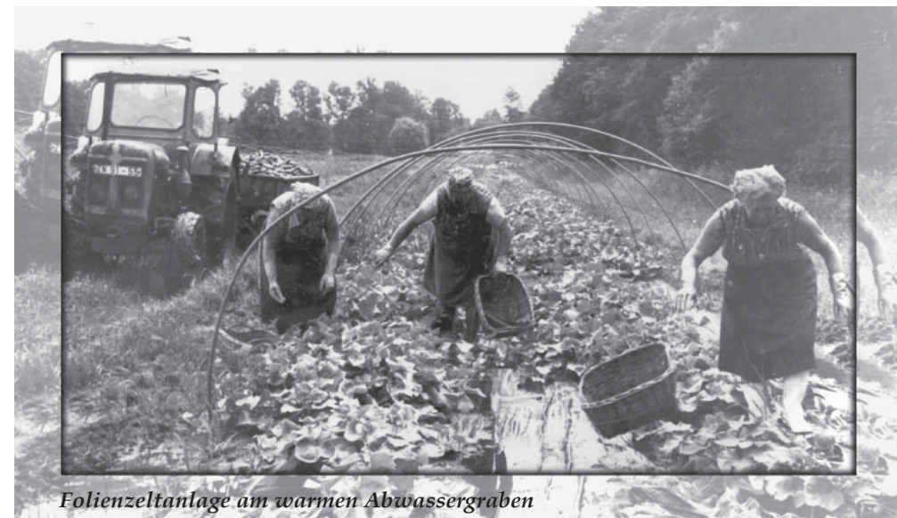
Folienzeltanlage am warmen Abwassergraben

Während die LPG-Bauern früher mit Hilfe einer Drillmaschine die Freilandgurken ausäten, geschieht dies heute mit der Einzelkorblegemaschine, die im Abstand von 20-30 cm 2-4 Körner auslegt.